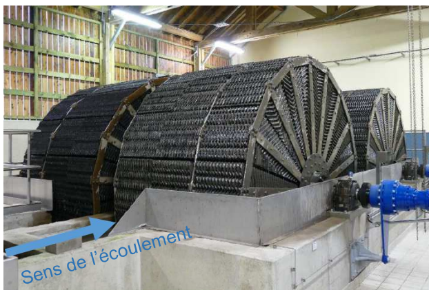
Figure 3 : Alimentation des disques biologique Exelio

L'écoulement est perpendiculaire à l'axe de rotation des disques (Figure 3), favorable à un temps de contact plus important. Les canaux sont dirigés tangentiellement à l'axe de rotation assurant un écoulement libre et direct de l'eau, sans risque de bouchage. Lorsque les canaux sortent de l'eau, ils se vident immédiatement ; le courant d'eau est alors perpendiculaire à la surface du bassin. Cette conception assure à tout moment une circulation turbulente d'eau au travers de l'élément, ce qui augmente sensiblement les forces de cisaillement. La multitude de canaux augmente la longueur du chemin de l'eau et donc le temps de contact avec la biomasse.